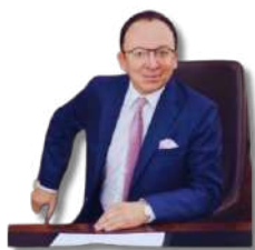
NUESTRO NUEVO PRESIDENTE