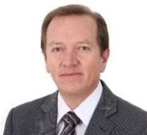
Nuestro Director Médico

Director Médico Hospital del Día Niños de la Mano de María